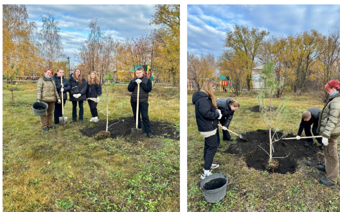
Рисунок 2 – Высадка сосен в студенческом парке

Внешне дерево напоминает нашу традиционную сосну обыкновенную, но хвоя у нее гораздо темнее. Дерево декоративное.