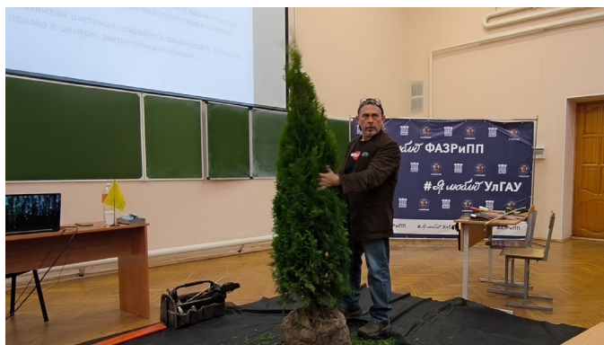
Рисунок 1 – Семинар «Топиарное искусство и Ниваки»

23 октября студенты практическом занятии по дисциплине «Введение в специальность» высадили в студенческом парке три хвойные дерева – Сосна Черная ( Pinus nigra ).