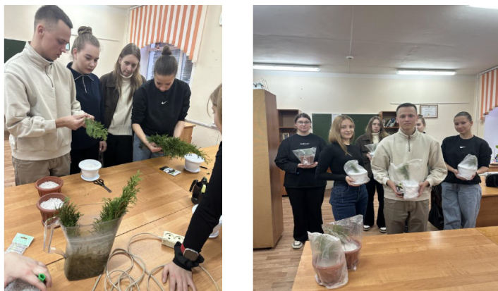
Рисунок 3 – Посадка веточек туи

7 ноября на практическом занятии студенты занимались посадкой веточек туи в вермикулит с обработкой стимулятором роста «Корневин». У каждого студента была индивидуальная веточка туи и каждый подписал горшок с собственноручно посаженным растением. Сейчас ребята ухаживают и поливают посаженные веточки, весной посмотрим выживаемости и корнеобразование растений.