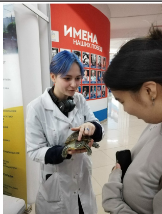
Рисунок 3 – Мастер-класс на международной выставке «Образование. Профессия. Карьера»

Также мастер-классы проводим учащимся школ Республики Бурятия, которые приезжают согласно плановым мероприятиям на экскурсию (рис. 4).