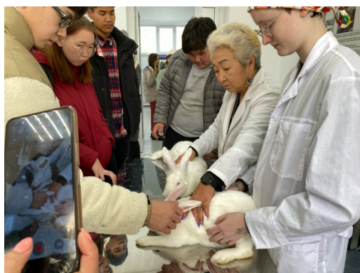
Рисунок 2 – Мастер-класс

При анализе проведенных мастер-классов выявили, что самой востребованной темой является: «Клинический осмотр кроликов» (рис. 2).