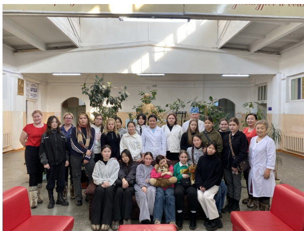
Рисунок 4 – Экскурсия школьников Хоринской СОШ № 2 им. Ю.А. Гагарина

Также мастер-классы проводим учащимся школ Республики Бурятия, которые приезжают согласно плановым мероприятиям на экскурсию (рис. 4).