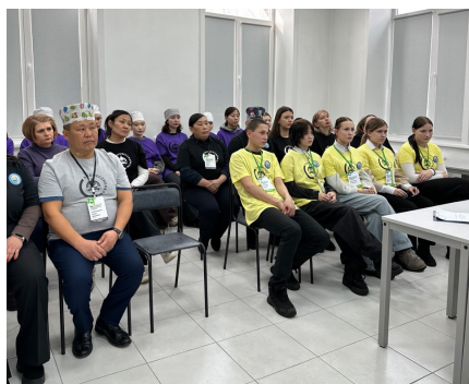
Рисунок 2 – Участники Чемпионата, категория «Юниоры»

В 2026 году впервые был проведен Чемпионат в категории «Юниоры», где конкурсантами выступили 5 обучающихся из двух Агроклассов Республики Бурятия: Хоринская СОШ им. Ю.А. Гагарина и Новозаганская СОШ (рис. 2).