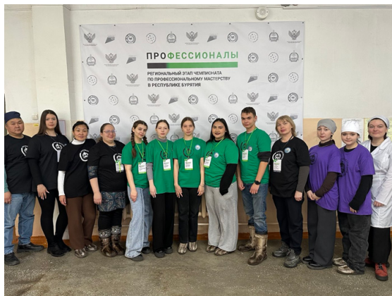
Рисунок 1 – Участники Чемпионата «Профессионалы» – 2026 (основная)

основная категория, где приняли участие обучающиеся двух колледжей: нашего Агротехнического и Бурятского аграрного колледжа им. М.Н. Ербанова (рис. 1).