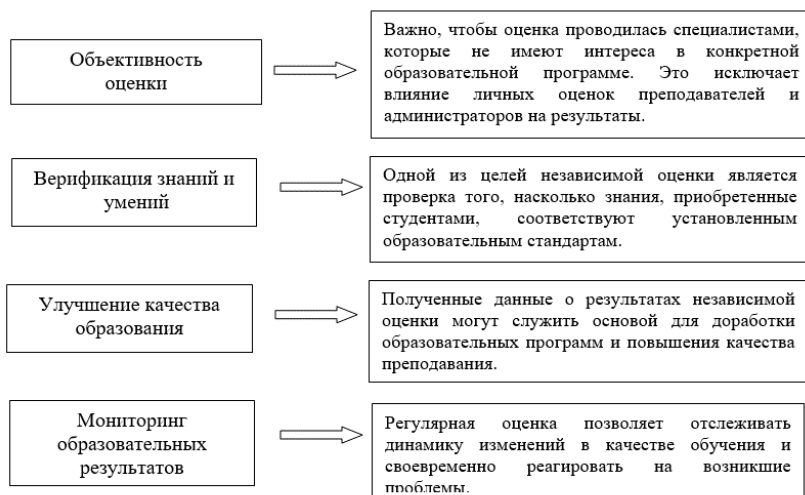
Рисунок 1 – Задачи независимой оценки качества обучения

во-первых, преподаватели, администрация вуза, зная, что их будут оценивать независимые эксперты, еще на стадии подготовки к приезду экспертов, начинают больше внимания уделять качеству обучения, а именно, совершенствовать свои навыки, разрабатывать новые подходы к обучению, обновлять программы, методический материал и др.;