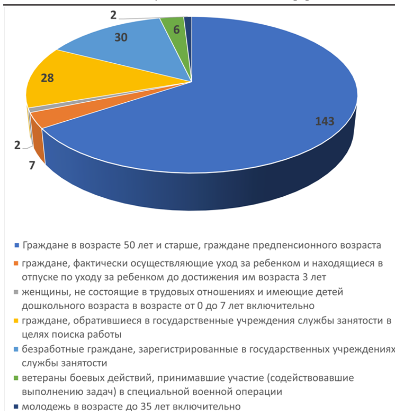
Рисунок 3 – Распределение обученных слушателей по категориям граждан, чел.

В перспективе, учитывая наработанные методики и полученный опыт реализации программ профессионального обучения федерального проекта «Активные меры содействия занятости» в Ульяновском государственном аграрном университете, планируется на 2027 и последующие годы расширить перечень реализуемых программ и увеличить количество обучающихся слушателей до 200 человек ежегодно.