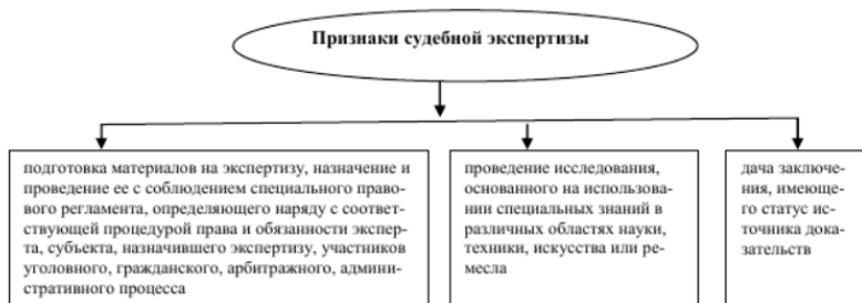
Рис. 1. Отличительные черты судебной экономической экспертизы от иных видов экспертиз в человеческой деятельности