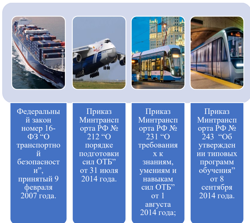
Рис. 2. Нормативные документы, регулирующие транспортную безопасность

Система обеспечения безопасности для каждого вида транспорта имеет свои особенности. Общее правовое регулирование данной отрасли в РФ осуществляется следующими нормативно-правовыми актами (рис.2) [2]: