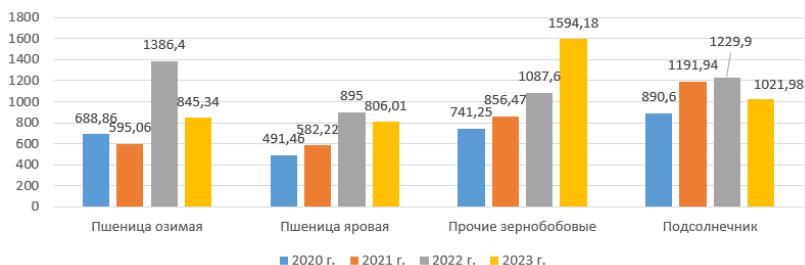
Рис. 1. Динамика себестоимости 1ц продукции растениеводства ООО «XXX» за 2020-2023 гг., руб.

руб./ц. Однако к 2023 году себестоимость по данной культуре снизилась на 89 руб./ц и составила 806 руб/ц.