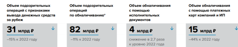
Рис. 3. – Объем подозрительных операций по обналичиванию денег [3]

Регулятор и банки проводили работу по противодействию схемам по отмыванию денег. Объем подозрительных операций снизился, при этом масштабы обналичивания с помощью исполнительных документов сокращались второй год подряд. Банки эффективно пресекали и обналичивание с помощью платежных карт – объем стал меньше после роста в 2022 г. Объем подозрительных операций с признаками вывода денежных средств за рубеж тоже сократился (рис. 3).