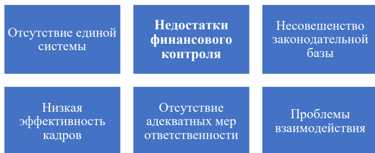
Рис. 5. – Недостатки в сфере налогового и бюджетного финансового контроля

Таким образом, с одной стороны, в экономике России наблюдаются тенденции к стабилизации. С другой стороны, более тщательный анализ выявил наличие недостатков в сферах налогового и бюджетного финансового контроля (рис. 5). Отсутствие в России целостной и согласованной системы финансового контроля приводит к дублированию функций различных органов и их некоординированности. Отсутствие единого закона о финансовом контроле создает правовые пробелы и затрудняет деятельность контрольных органов. Система подготовки кадров для органов финансового контроля не отвечает современным требованиям, что сказывается на профессионализме и компетентности контролирующих лиц. Отсутствие адекватных мер ответственности нарушителей законодательства не способствует повышению финансовой дисциплины среди экономических субъектов. Неразвитость механизмов взаимодействия между различными государственными органами затрудняет координацию действий и обмен информацией, что также снижает эффективность контроля.