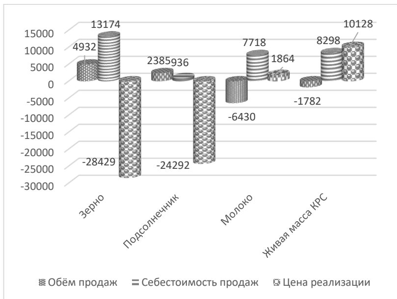
Рис. 2. Влияние факторов на изменение суммы прибыли от продаж основных видов продукции

Несмотря на то, что реализация животноводческой продукции остается на протяжении всего периода исследования убыточной, сумма убытка в динамике сокращается. Увеличение объемов продаж убыточных продуктов несомненно влечет за собой увеличение суммы убытка, в то время как снижение их себестоимости и повышение цены реализации молока и живой массы крупного рогатого скота привели к снижению общей суммы убытка (рисунок 2) [5].