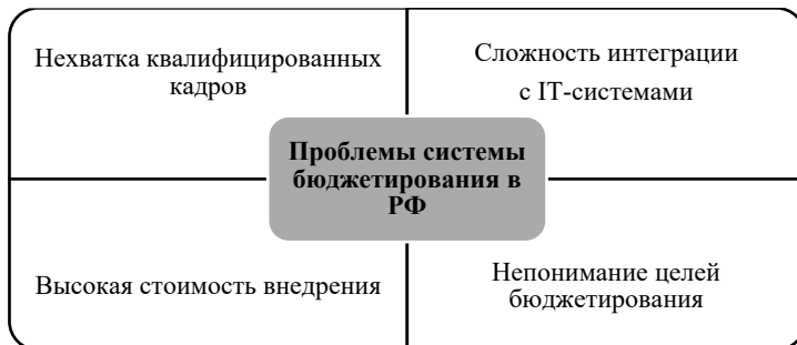
Рис. 1. – Основные проблемы внедрения бюджетирования в организации

предприятий (рис. 1). Ключевыми среди них являются: кадровый дефицит, технические барьеры, финансовые ограничения и отсутствие понимания целей.