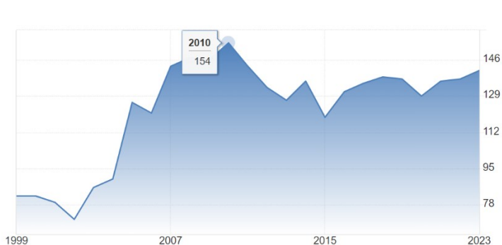
Рис. 2. Уровень коррупции в России с 1999-2023 гг.

Согласно Индексу восприятия коррупции за 2023 год, опубликованному организацией Transparency International, Россия занимает 141-е место из 180 стран по уровню коррупции. С 1996 по 2023 год уровень коррупции в России в среднем составлял 115,75, достигнув рекордного максимума в 154,00 в 2010 году и рекордного минимума в 47,00 в 1996 году (рис. 2).