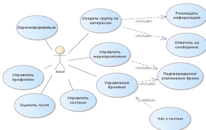
Рис. 1. Диаграмма вариантов использования для владельца хоста

Варианты использования онлайн-платформы сети гостеприимств владельцами хостов представлены на рисунке 1.