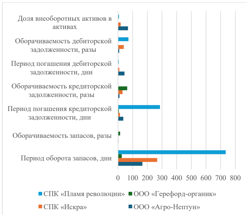
Рисунок 2 – Сравнительный анализ показателей деловой активности за 2022 г.

кредиторской задолженности в ООО «Агро-Нептун» составили 35,9 дней и 10,16 оборотов, но в СПК «Искра» и ООО «Герефорд-органик» данные показатели имеют лучшие значения (рис.2).