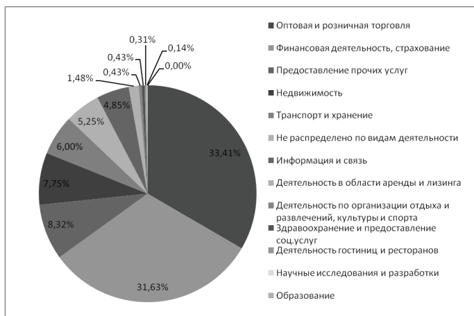
Рисунок 1 - Структура прямых иностранных инвестиций в РФ за 2014 г.