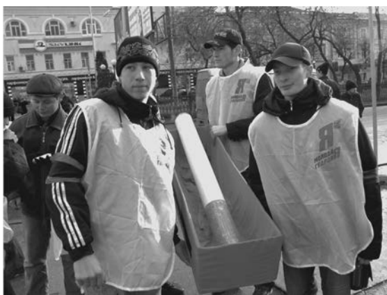
Сигарету загнали в гроб

Мероприятия начались еще 17 ноября. Во всех учебных корпусах и общежитиях были помещены материалы, информирующие о вреде курения и призывающие бросить вредную привычку и обратить внимание на своё здоровье. Также в течение недели проводилась агитация здорового образа жизни, жизни без никотина. А основные события развернулись 20 ноября. С самого утра профкомовцы обменивали на территории академгородка сигареты на конфеты. Желающих сделать это оказалось немало. К обеденному перерыву на площади инженерного факультета несмотря на плохую погоду собралось около ста человек. Программа мероприятия была основана на состязаниях курящих