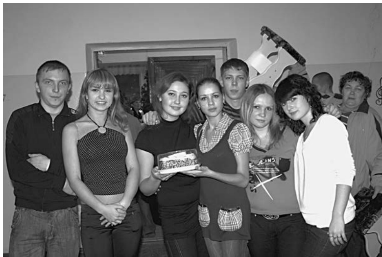
На песенном конкурсе

Конечно, никто не остался без поощрения. А студсовет был вознагражден положительной оценкой мероприятия, данной гостями.