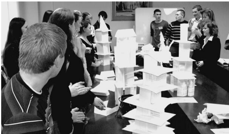
Тренинг на создание команды

Первые три недели работы Школы были посвящены обучению участников проекта – более 100 человек из 4 образовательных учреждений Ульяновской области: нашей академии, высшего авиационного училища, института авиационных технологий, Октябрьского сельского лицея. Тренинги и семинары для них