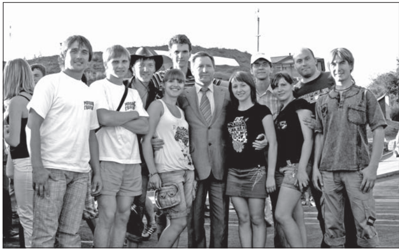
«Академики» с губернатором Липецкой области О. Королевым

С 2 по 9 августа в с. Никольское Липецкой области прошёл федеральный молодёжный политический лагерь «Молодой Гвардии Единой России» «Гвардия-2020», который назван главным политическим событием Года молодёжи в РФ. Он собрал более 1000 человек из всех регионов России, а также представителей Абхазии, Азербайджана, Белоруссии, Украины, Южной Осетии, Приднестровья и других стран ближнего и дальнего зарубежья.