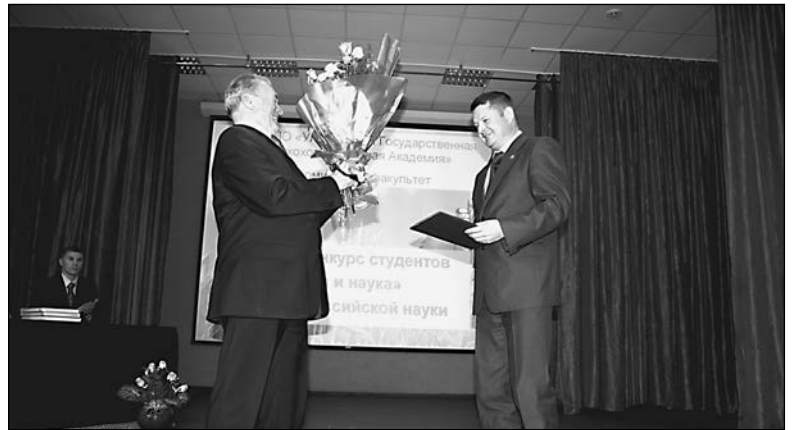
Цветы от мэра – ректору и всей академии

Дипломники пяти профилирующих кафедр агрономического факультета подготовили презентации научно-исследовательской работы, которые сопровождались подробными комментариями с представлением научно-педагогического состава кафедр, научных направлений и возможностей самореализации студентов в науке.