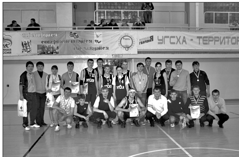
Призеры соревнования по баскетболу, прошедшего 18 февраля