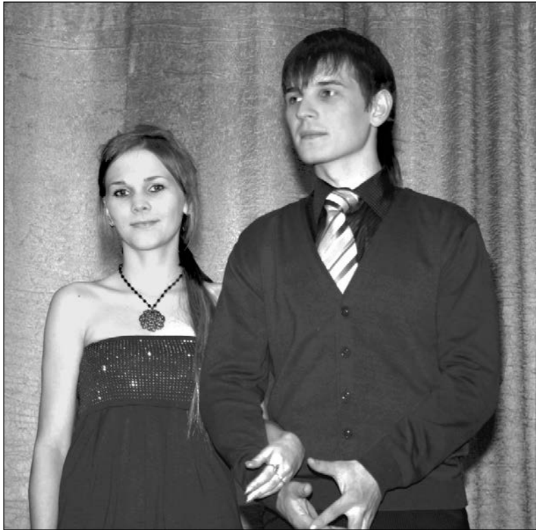
Самая романтичная пара академии

11 февраля на факультетах академии, украшенных плакатами, воздушными шарами в форме сердца, всевозможными «валентинками», проводились различные мероприятия, посвященные Дню влюбленных. На экономическом факультете можно было даже «зарегистрировать» свои отношения в студенческом загсе.