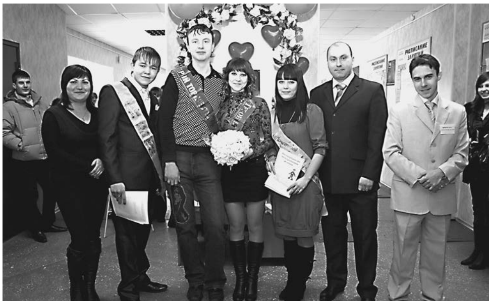
На экономическом факультете открыли ЗАГС.