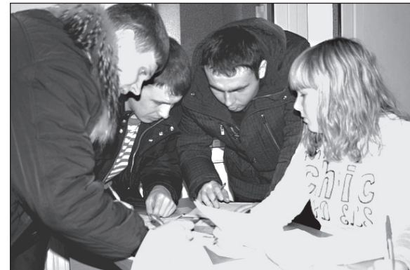
Работой на ООО «Mars» заинтересовались многие студенты