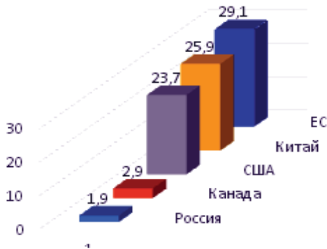
Рисунок 1 - Уровень совокупной государственной поддержки сельского хозяйства в расчете на 1 га пашни, тыс. руб.

Первоначально на погектарную поддержку было выделено около 15 млрд. рублей, а в течении года добавлено еще 10 млрд. рублей. В расчете на 1 га пашни в ЕС приходится примерно от 300 до 500 евро государственной поддержки, а в России в предшествующие годы 20 – 50 евро (110 млрд руб. на 80 млн га пашни, то есть 1375 руб./га), то есть в ЕС поддержка на гектар пашни в 13 раз больше, чем в России (рис. 1).