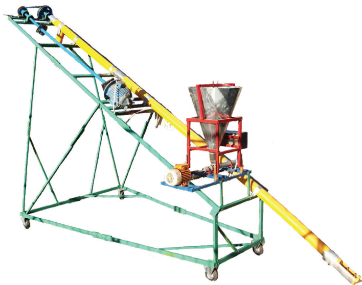
Рисунок 2 – Общий вид смесителя минеральных удобрений

Для определения основных технических характеристик был создан и опробован в лабораторных условиях опытный образец смесителя, который представлен на рисунке 2.