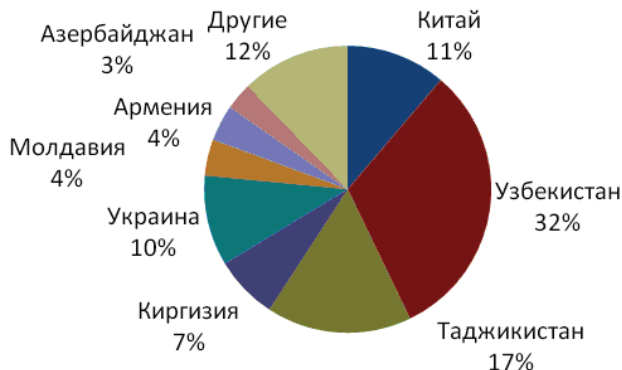
Рисунок 2 - Доля основных стран-доноров рабочей силы в России за 2010 год, в %.

Поток трудовых мигрантов в Россию идёт из нескольких десятков стран. По данным сайта ФМС доля каждой страны донора представлена на рис. 2.