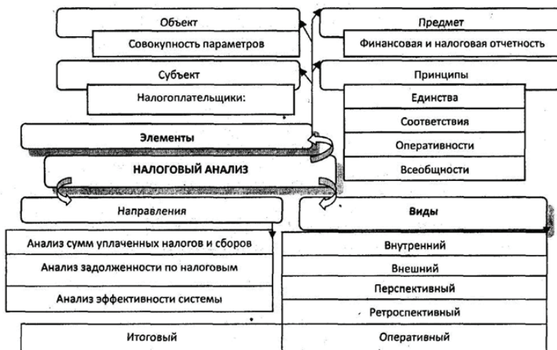
Рисунок 1 – Концептуальные элементы налогового анализа коммерческой организации