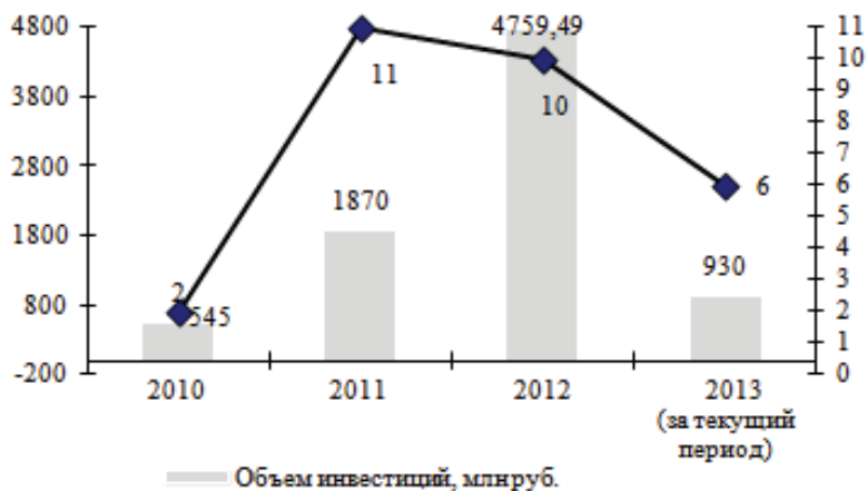
Рисунок 2 – Динамика количества инвестиционных проектов и объема инвестиций в сельском хозяйстве Ставропольского края за 2010–2013гг.

Динамика количества инвестиционных проектов и объема инвестиций в сельском хозяйстве Ставропольского края за 2010–2013гг. положительна (рис. 2).