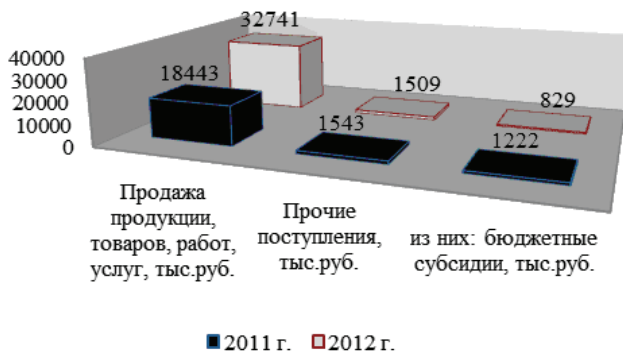
Рисунок 1 – Состав и структура поступления денежных средств по видам деятельности