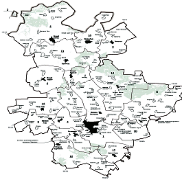
Рисунок 1 - Карта-схема границ муниципальных образований, входящих в состав МО «Арский муниципальный район»

художественной решеткой. Музейный комплекс начинается широкой аллеей, идущей мимо изогнутых стволов деревьев, напоминающих Шурале и других обитателей волшебного леса. Музейный комплекс является филиалом Государственного Объединенного музея Республики Татарстан.