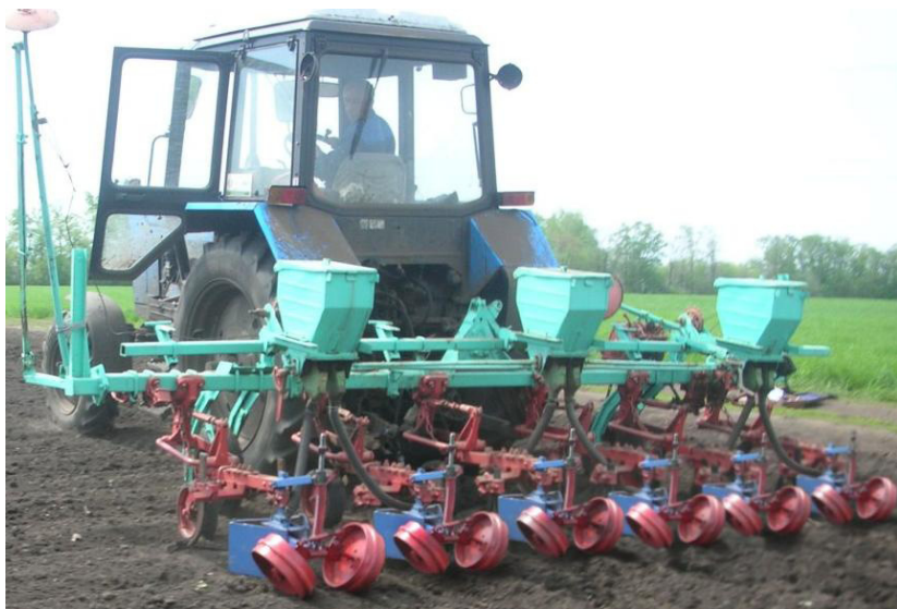
Рис. 1. - Гребневая сеелка, оснащенная комбинированными сошниками