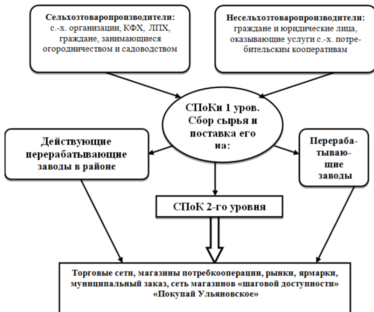
Рисунок 1 – Система управления закупкой, переработкой и реализацией сельскохозяйственной продукции в Ульяновской области

основе) до реализации готовой продукции в торговых сетях, магазинах потребительской кооперации, а также участии в муниципальных закупках для поставок сельскохозяйственной продукции в учреждения бюджетной сферы (рис.1).