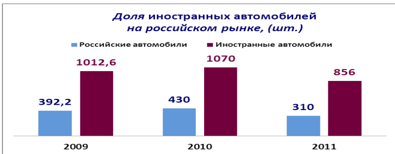
Рис. 2 Доля иностранных автомобилей на российском рынке

В период с 2009 года покупатель российского автомобильного рынка отдает предпочтение отечественному производителю. Мы видим, что на протяжении трех лет объем продаж не изменяется, однако прослеживается тенденция к снижению продаж автомобилей. В 2009 году резко снижаются до 300 т.шт. в год, что сократило объем продаж в 2 раза. В 2010 и 2011 г. наблюдается не значительное увеличение продаж, которое во многом связано с поддержкой государства, и антикризисной политикой самих предприятий. Так же можно отметить, что продажи иностранных автомобилей произведенных на территории РФ, растут, и тем самым вытесняют российские бренды. Однако финансовый кризис