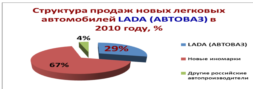
Рис.3 Структура продаж новых легковых автомобилей LADA (АВТОВАЗ) в 2010 году

Сегодня с уверенностью можно заявить, что ОАО «АвтоВАЗ» - самый крупный автопроизводитель России и Восточной Европы, переживает не лучшие времена.