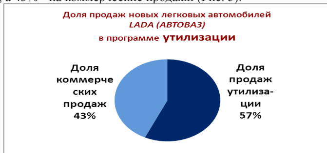
Рис. 5 Доля продаж новых легковых автомобилей LADA по программе утилизации

Большая часть выручки от общей продажи автомобилей приходится на утилизацию, которая стала своего рода спасательным кораблем для «АвтоВАЗа», при этом 57% всех продаж приходится на долю утилизации, а 43% - на коммерческие продажи (Рис. 5).