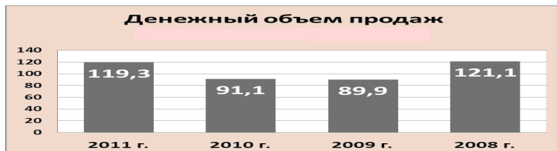
Рис. 4 Денежный объем продаж автомобилей, млн. руб.

На сегодняшний день его доля на российском автомобильном рынке составляет меньше 29% от общей доли рынка (Рис. 3). При этом наиболее продаваемые марки автомобилей это «Лада Приора», «Лада Самара», «Лада 2104/2105/2107», и с 2010года реализуется проект новой модели «Лада Гранта».