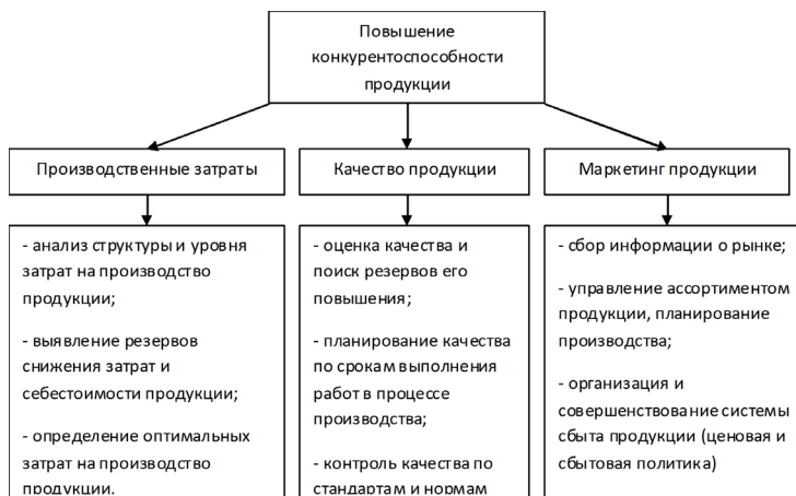
Рис. 2 - Схема направлений повышения конкурентоспособности зерновой продукции.

Конкурентоспособность зерновой продукции формируется под воздействием комплекса факторов, изучение которых позволило определить основные направления ее повышения, включающие в себя комплекс мероприятий для товаропроизводителей (рис. 2). Для оценки конкурентоспособности товара служит метод «Цена — качество». Исходная позиция метода ~ конкурентоспособность производителя тем выше, чем выше конкурентоспособность его продукции.