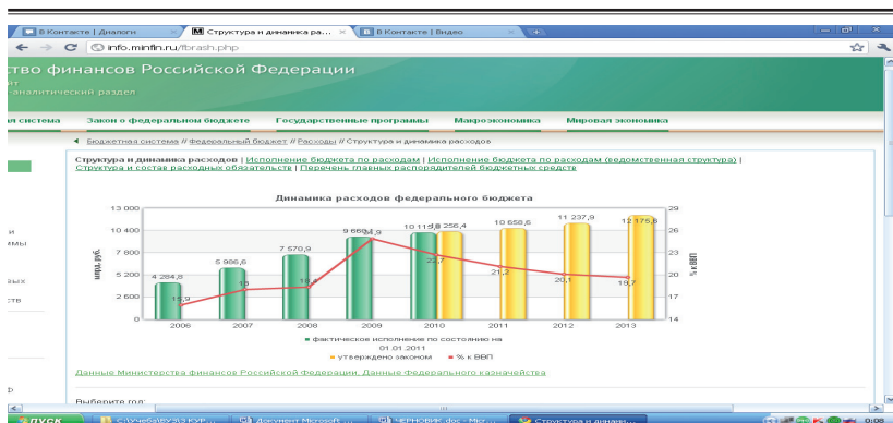
Рисунок 1 – Динамика доходов и расходов федерального бюджета

Дефицит бюджета для большинства стран – нормальное явление. Например, Великобритании удалось преодолевать проблемы дефицитного бюджета лишь 6 раз за последние сорок лет. Все остальные годы страна жила с существенным дефицитом.