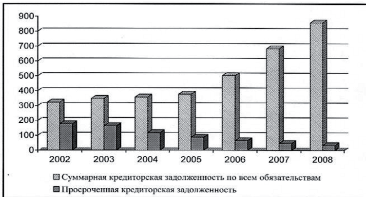
Рисунок 3 – Кредиторская задолженность сельскохозяйственных организаций России, на конец года, млрд. руб.

Вместе с тем, тенденции ухудшения финансового состояния сельскохозяйственных организаций нельзя считать преодоленными. В настоящее время около 30% сельскохозяйственных предприятий России являются убыточными, рентабельность продаж составляет всего 9,7%, а, стало быть, существуют реальные предпосылки к прекращению ими хозяйственной деятельности. [6]