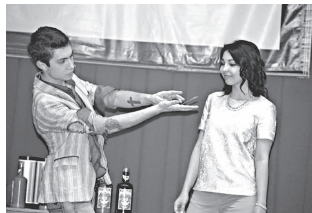
Фокусник из филиала УГСХА поразил всех

Учредитель, издатель – УГСХА имени П.А. Столыпина. Адрес учредителя и издателя: г. Ульяновск, б. Новый Венец, 1. Адрес редакции: Ульяновская область, Чердаклинский район, пос. Октябрьский, ул. Студенческая, д. 15а. Тел. 55-95-45 Главный редактор В. Насырова. E-mail: usa-press@yandex.ru Зарегистрирована Управлением Роскомнадзора по Ульяновской области. Свидетельство о регистрации СМИ ПИ № ТУ73-00226 от 2.11.2011 г.