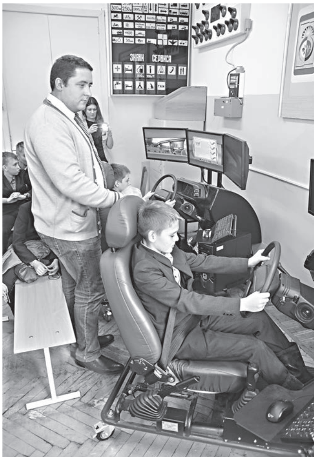
В приоритетах факультета – реализация образовательной программы для школьников «Основы инженерного искусства»