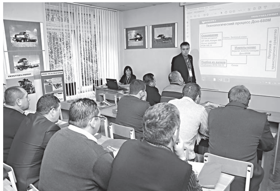
Специализированные классы крупнейших производителей сельскохозяйственной техники «РОСТСЕЛЬМАШ» и «ГОМСЕЛЬМАШ» позволяют УГСХА поднять на более высокий уровень качество подготовки специалистов в сфере АПК, а также проводить на своей площадке курсы переподготовки и повышения квалификации механизаторов и комбайнеров агропредприятий.