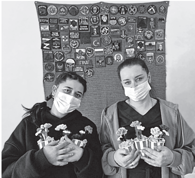
Студентки факультета агротехнологий, земельных ресурсов и пищевых производств сделали и отправили на фронт военным медикам к 8 Марта праздничные открытки и букетики неувядающих цветов

С начала 2024 года УлГАУ изготовил и отправил на фронт 93 маскировочные сети, каждая из которых играет большую роль в стратегической маскировке на фронте. А в 2023-м удалось сплести 212 сетей, которые уже находятся на передовой и защищают наших солдат. Все они направлены в адрес различных подразделений и батальонов. Большая часть укрытий создана из материалов, предоставленных волонтерской группой «ZV» и закупленных на средства университета и студентов.