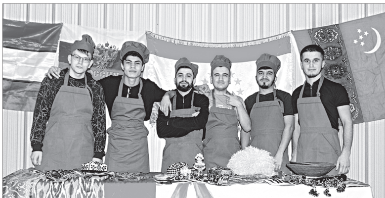
Сближению студентов из различных стран служат проводимые в вузе фестивали и конкурсы

«Реализация мероприятий по адаптации иностранных студентов в нашей стране практикуется уже достаточно давно. За последние несколько лет нашей команде удалось выявить наиболее проблемные зоны в этом вопросе и структурировать мероприятия таким образом, чтобы максимально быстро достигать поставленной цели. Этому способствовала грантовая поддержка Правительства Ульяновской области,