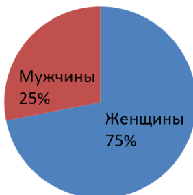
Рис. 1 Половой состав случайной выборки.

Исходя из полученного результата, я сделала первый вывод, что в вузе обучается больше девушек, чем юношей. Распределив выборку по половому признаку (Рис. 2, Рис.3) я убедилась в правильности тезиса антропологов, которые утверждают, что у мужчин рецессивный признак тонких губ встречается чаще, чем у женщин. По результатам моих исследований у девушек полные губы встречались чаще, чем у юношей.