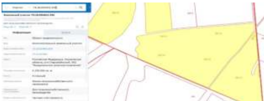
Рис. 1 – Местоположение земельного участка

Результаты исследования. Рассмотрим на примере земельного участка, расположенного в Ульяновская область Старомайский район МО «Кандалинское сельское поселение» СПК «Рассвет». (Рисунок 1).