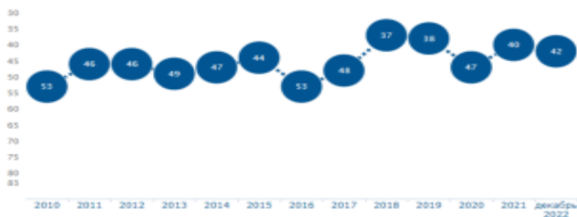
Рис. 4 – Место Ульяновской области в рейтинге по показателю зарегистрированных преступлений экономической направленности

При этом в 2022 году по области было выявлено 413 человек, совершивших преступления экономической направленности, что на 38% меньше, чем в 2010 году (рисунок 5). Если сравнивать данные по регионам, то они имеют различия в сотни раз. Самое большое количество преступников в 2022 году было выявлено в Москве – 3501 человек, а самое малое – в Чукотском автономном округе – 35 человек.