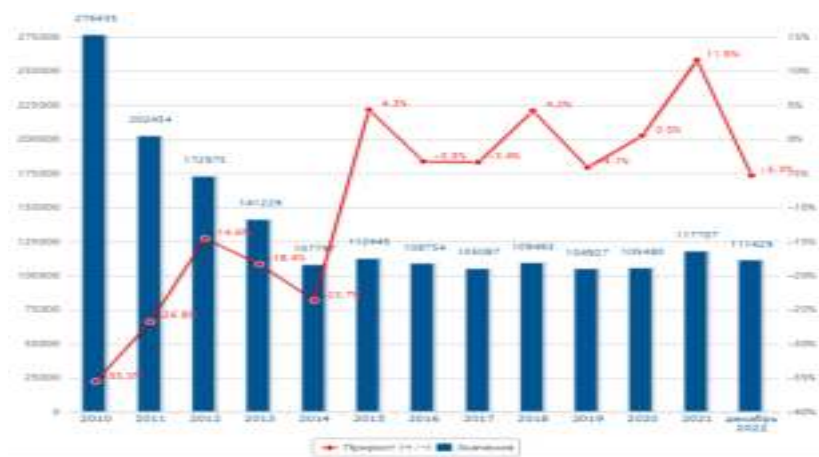
Рис. 2 – Динамика преступлений экономической направленности по России

Но интересен тот факт, что в рейтинге по показателю зарегистрированных преступлений экономической направленности Ульяновская область в 2010 году занимала 53 место, а в 2022 году 42 место, несмотря на значительное сокращение количества преступлений (рисунок 4).