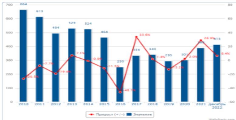
Рис. 5 – Динамика выявленных лиц, совершивших преступления экономической направленности по Ульяновской области

К сожалению, причин совершения экономических преступлений в настоящее время в России довольно много. Их можно разделить на несколько категорий: