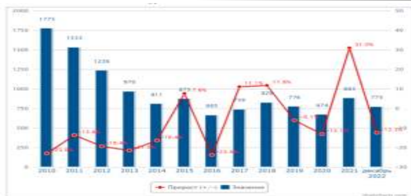
Рис. 3 – Зарегистрировано преступлений экономической направленности в Ульяновской области