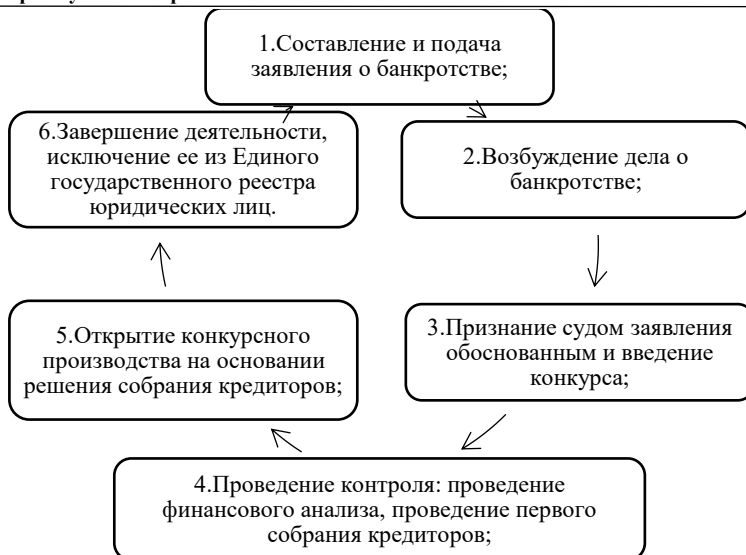
Рис. 1 – Этапы проведения процедуры банкротства в РК

Примечание – составлено автором по источнику [2].