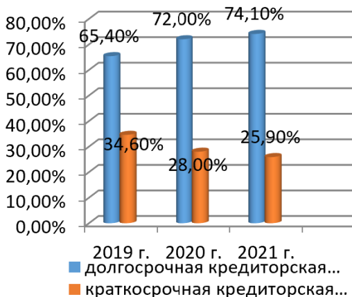
Рис. 2 – Структура кредиторской задолженности, % задолженности, %

Как показывают данные рисунка 1, наибольший удельный вес в структуре дебиторской задолженности на протяжении всего периода исследования принадлежит расчетам с покупателями и заказчиками в среднем 87,5%. В структуре кредиторской задолженности наибольший удельный вес занимает долгосрочная в среднем 70,5 % (Рис. 2). Нами был проведен анализ эффективности оборачиваемости задолженности в организации (таблица 1).