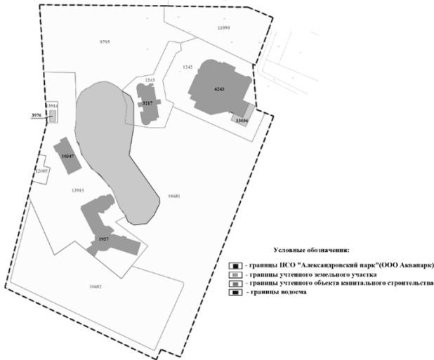
Рис. 1 – Схема организации территории ПСО «Александровский парк»

Как уже выше обозначалось проект будет размещен на территории разграниченного земельного участка КН 73:19:073201:10682 с видом разрешенного использования—«Для размещения и эксплуатации рекреационной зоны для целей несвязанных со строительством, для ИЖС», своей западной стороной примыкает к улице Александровской, и хозяйственная постройка в границах земельного участка 73:19:073201:13915. Проектом предусматривается разграничение территории вилл для установки ограждения и организации внутреннего пространства территории для размещения ОКС. Большая часть разграничиваемых территорий вилл находится в границах рассматриваемого земельного участка, за исключением земельных контуров виллы № 3 в границах характерных координатных точек 17-25 расположенной в серной части комплекса вилл, где граница в координатных точках 22-23 протяженностью проходит по территории земельного участка КН 73:19:073201:13915. Так же следует отметить, что разграничиваемые территории вилл №№ 9-14, расположенных в южной части рассматриваемого участка своими южными границами расположены вдоль лесопосадки на территории