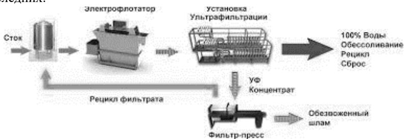
Рис. 3 – Фильтрация сточных вод

Песколовки предназначены для выделения механических примесей с размером частиц 200...250 мкм. Необходимость предварительного выделения механических примесей (песка, окислы и др.) обуславливается тем, что при отсутствии песколовки эти примеси выделяются в других очистных сооружениях и тем самым усложняют эксплуатацию последних.