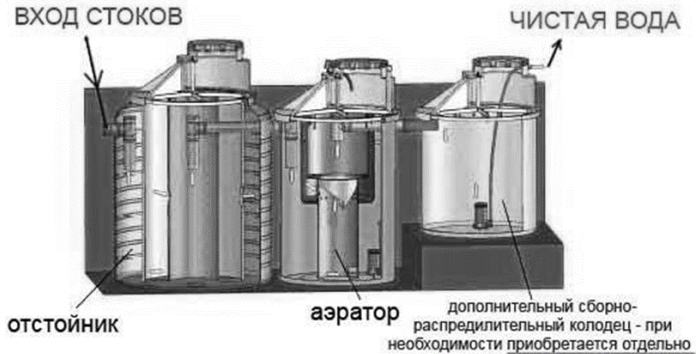
Рис. 1 – Отстойники для очистки сточных вод

Осаждение взвешенных частиц под действием центробежной силы проводится в гидроциклонах и центрифугах. Для очистки сточных вод, как правило, используют напорные и открытые гидроциклоны (рис. 2). Гидроциклоны применяют для разделения осаждающихся и всплывающих примесей. Гидроциклоны просты по устройству, компактны, легко обслуживаются, имеют высокую производительность и небольшую стоимость.