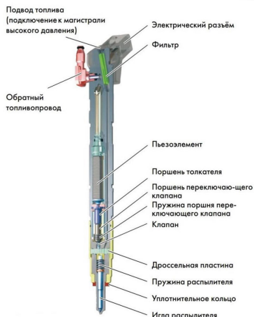
Рис. 3 – Пьезоэлектрические форсунки

К основному недостатку относят высокую стоимость пьезоэлектрических форсунок. Они крайне чувствительны к качеству топлива, не поддаются ремонту и восстановлению, а их замена обходится владельцу в круглую сумму.