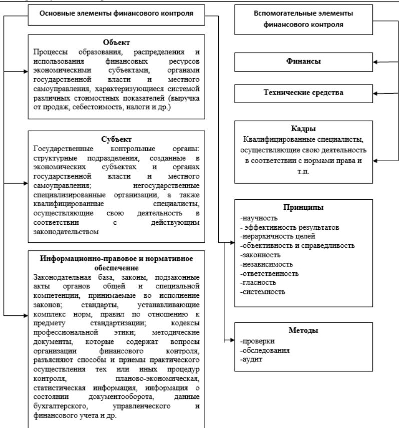
Рис. 1 – Основные этапы финансового контроля [4]

Процесс финансового контроля, включающий основные семь этапов представлен на рисунке 2.