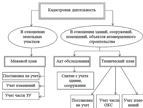
Рис. 2 – Схема кадастровой деятельности

Основанием для выполнения кадастровых работ кадастровым инженером считается соглашение подряда, которое кадастровый инженер обязан предоставить заказчику. В них указывается граница и площадь участка, реквизиты клиента и персональный номер. На рисунке 2 представлена схема кадастровой деятельности, где указаны требуемые документы.