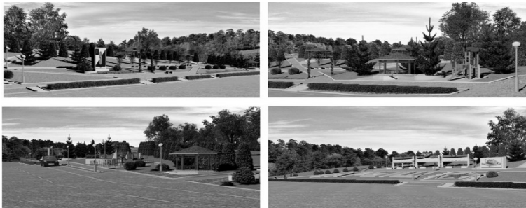
Рис. 2 – Малые архитектурные формы, предполагаемые проектом

Следовательно, концепцией благоустройства предполагается создание сквера «Семейный» в г. Барыш, по ул. Ленина, 137. Данный сквер будет местом повседневного и оздоровительного отдыха для различных возрастных групп населения, воспитание патриотизма у подрастающего поколения. Также концепция предполагает привлекательный вид при въезде в город Барыш. На территории предполагается: создание оборудованных и благоустроенных мест отдыха для населения; установка спортивного и игрового комплексов «Парусник», скамеек и урн, детскую игровую площадку, декоративных фонарей освещения, беседок, декоративных арок, Доски почета, стелы «Герб города Барыш», декоративного ограждения (рис. 2).