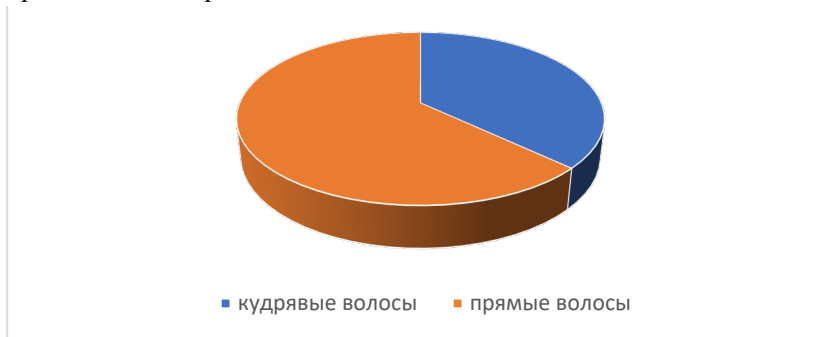
Рис. 2 – Характеристика структуры волос у студентов экономического факультета.

Также были обследованы 50 студентов экономического факультета. Результаты исследований мало отличались от предыдущих. Среди студентов экономического факультета 37% имели доминантный признак - кудрявые волосы, а остальные 63% - рецессивный. Результаты представлены на рис. 2.