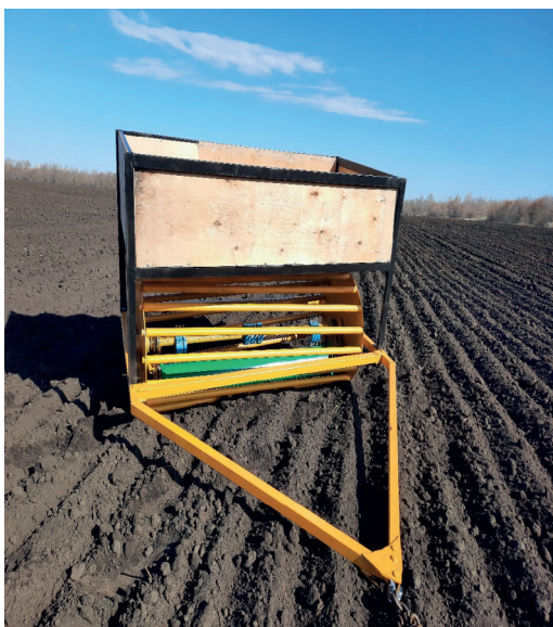
Рис. 1 – Экспериментальный образец виброкатка

очередь, негативно влияет на урожайность возделываемых культур.