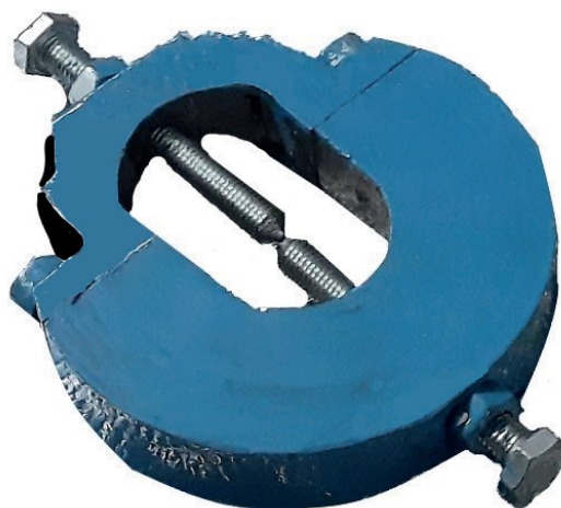
Рис. 2 – Общий вид дебалансира

Дебалансир выполнен с возможностью изменения положения оси катка с помощью регулировочных болтов, поэтому в качестве одного из действующих независимых факторов процесса было принято положение центра масс дебалансира относительно оси катка. Для опре-