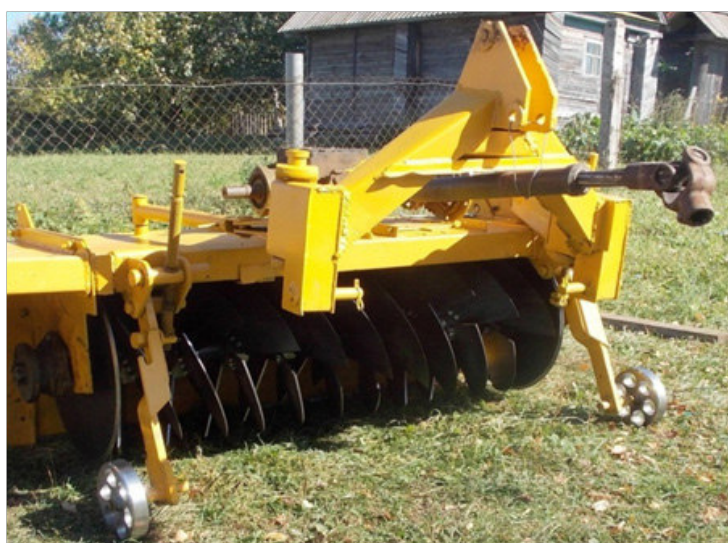
Рис. 3 – Опытный образец ротационного плуга (рыхлителя) РР-2