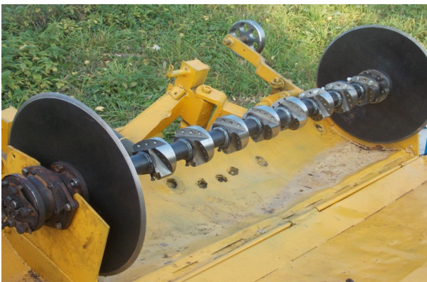
Рис. 5 – Плоские диски на опытном образце ротационного плуга

\xi = 0,5 - 0,6 ( \xi = \frac{h}{r} , где h - глубина обработки почвы, r - радиус рабочего органа с эллиптическими лопастями); кинематический параметр