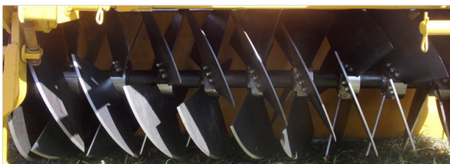
Рис. 4 - Батарея РРО с эллиптическими лопастями