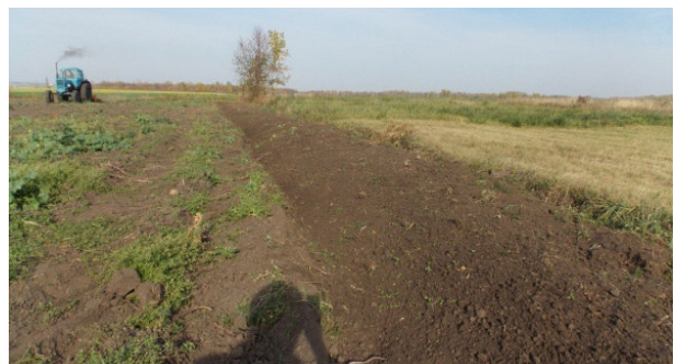
Рис. 6 – Производственно-полевые испытания ротационного плуга (рыхлителя) РР-2 а) плуг в работе; б) поверхность поля после обработки