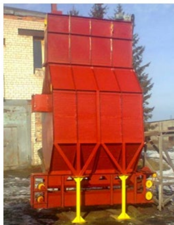
Установка С3-1 Стоимость - 1200 тыс. руб.