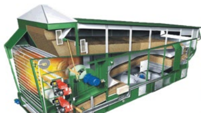
Установка УСК-8 Масса установки - 560 кг.

Материалы и методы исследований. В результате анализа современного оснащения хозяйств зерносушильной техникой выявлено, что наиболее распространены зерносушилки с конвективным подводом теплоты (рисунок 1).