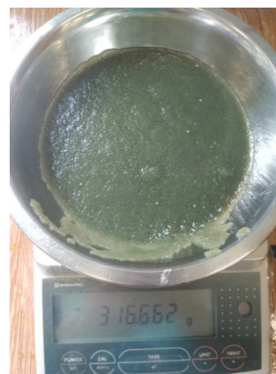
1(в). 5 опытная группа