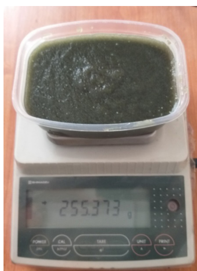
1(б) 3 опытная группа