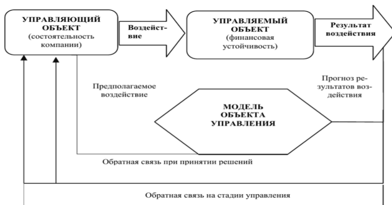
Рисунок 1 – Схема управления финансовой устойчивостью предприятия

Поэтому возникает необходимость управлять финансовой устойчивостью, а для этого нужно создать целую систему, состоящую из нескольких подсистем, влияющих друг на друга, вносящих изменения в поведение этой системы для достижения цели организации при наименьших затратах. Представим такую систему на рисунке 1.